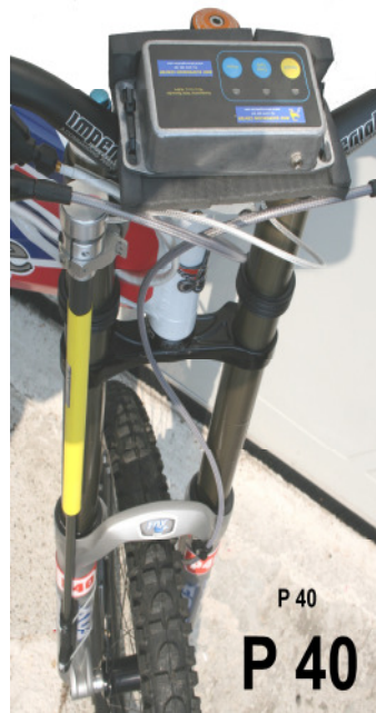
Nichts wird dem Zufall überlassen