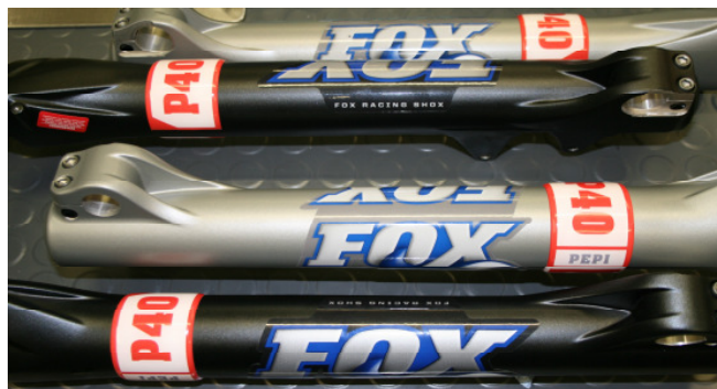
Das Kennzeichen, das den Unterschied macht

P 40 , P wie Pepi, 40 wie 40 verschiedene Tuning Parts und Überarbeitungen an diversen Teilen, die jede individuell getunte Fox Forx 40RC2 zum absoluten Überflieger für Hardcore – Racer macht.