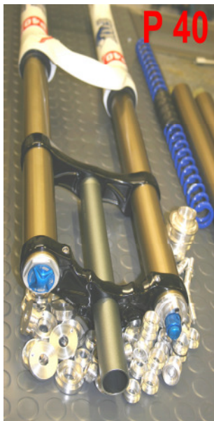
Objekt der Begierde

Das daraus entstandene elitäre Produkt, wird auf der einen Seite durch seine raffinierte Verarbeitung und ausgeklügelten Technischen Lösungen und auf der anderen Seite durch die einfache Handhabung gekennzeichnet.